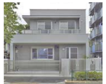
東京都 A様邸（木造耐火住宅）