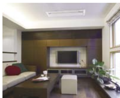
天井埋め込みタイプ