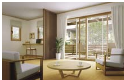
YKK AP 株式会社 プラマード U

高気密仕様の機能的なサッシ、複層ガラスへ変更のご依頼が増えています。高い断熱性に加えて、防音・防犯効果にも優れておりスマートカーパー工法（YKK AP（株））など設置工期も短くお勧めです。