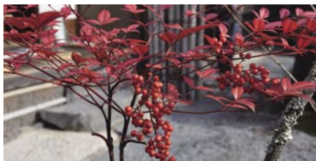
季節の写真 表紙・裏雨宮 修 (組合員)