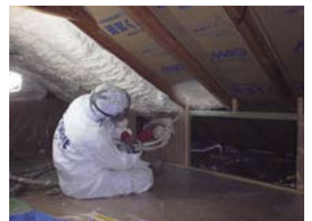
アイシネン 首都圏断熱株式会社

吹付け型発泡剤の断熱材です。すき間を残すことなく気密断熱します。短い工期(最短2日)で施工可能で高い断熱効果が得られます。剥離や脱落リスクが低く経年劣化を起こさないことも特徴です。