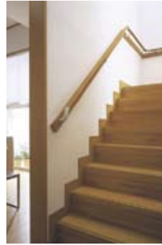
←玄関・廊下・階段手すり