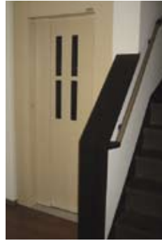
←ホームエレベーター 丁様邸