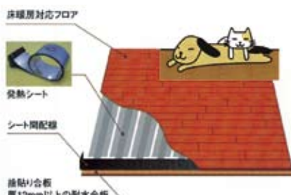
メビウス 山中産業株式会社

お部屋の空気を汚すことなく安全で快適なシステムです。伝導熱と輻射熱のダブル暖房、メンテナンス不要のメリットがあります。