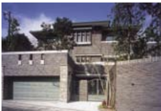
↑鉄筋コンクリート住宅