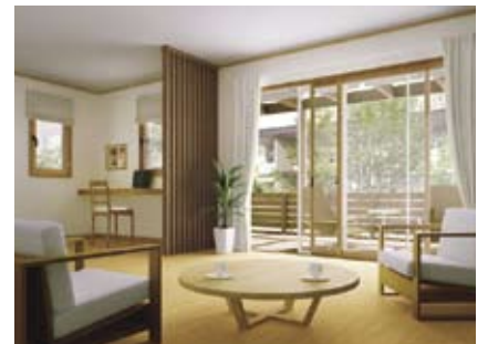
ブラマードU YKK AP 株式会社

内窓工法により短工期で取り付けられます。断熱性能が高く防音・防犯効果も得られる優れた窓です。他にも複層ガラスに交換することも有効です。