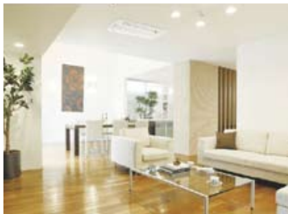
天井埋め込み型 ダイキン工業株式会社

加湿機能付き空調機。お掃除機能など性能も向上しています。TESからの交換工事も的確に施工しています。省エネ性能も向上しており新触媒採用の地球に優しいエコ仕様です。