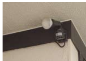
人感センサー 玄関フラッシュライト

防犯設備として録画機能の付いたインターフォンをおすすめしています。訪問者を記録に残すことで安心感が増します。またサッシのガラスを防犯ガラスに交換することも外部からの侵入防止に効果があります。