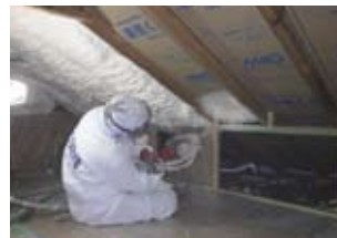
吹付け型断熱材アイシネン

夏涼しく、冬は暖かく。過ごしやすい住環境創りに断熱性能の高いサッシや吹付け型断熱材をおすすめしています。断熱サッシは防音、防犯効果にも優れています。カバー工法で簡単に施工することが可能です。断熱材アイシネンは短い工期ですき間なく気密断熱します。