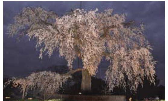
京都 円山公園しだれ桜 撮影 雨宮 修 組合員