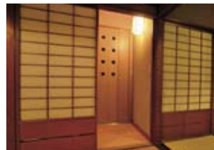
ホームエレベーター施工例

ホームエレベーターの設置工事を数多く施工しています。階段の昇り降りが困難になられたご家族がいらっしゃる場合はとても有効な設備です。ご予算とご計画を伺い、プランをご提案します。暑い夏の前に省エネ性能が向上している空調機器交換もお勧めです。