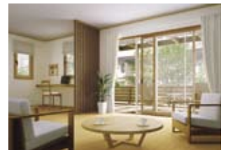
ブラマードU (YKK AP 株式会社)