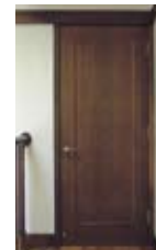
室内フラッシュドア