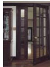
リビング親子ドア

室内ドアや収納建具の他、玄関ドアや窓、ジャロジーなどの金物交換のご用命も多く承っています。摩耗や損傷、部品欠落などにより使用困難なドアの補修、交換工事、木製ドアの塗り替え工事も行っています。