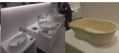
デザイン性のある洗面台