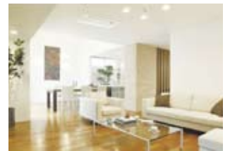
天井埋め込み型エアコン (ダイキン工業株式会社)