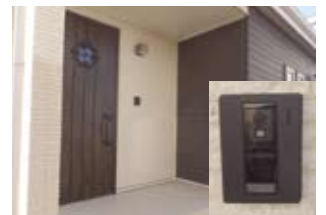
録画機能付きインターフォン

くらしの共生舎ではエコポイントリフォームを承っています。省エネ住宅ポイントは政府予算がなくなり次第終了となります。(工事対象期間：平成 26 年 12 月 27 日～平成 28 年 3 月 31 日)