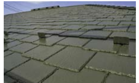
コロニアル屋根の塗り替え例（遮熱塗料）