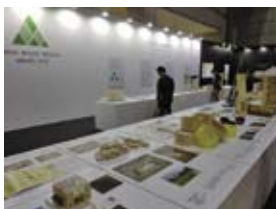
ジャパンウッドデザイン賞