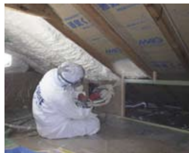
吹き付け型断熱材

*床下施工の場合は建築の状況により施工できない場合もありますのでまずはご相談ください。