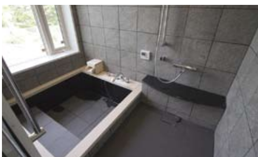
御影石とヒノキ浴槽

お風呂も石造りや檜材などお気に入りの材料で製作します。 我が家だけのゆとりある特別なお風呂はいかがでしょう。 あわせて洗面化粧台もオーダー製作のご要望にお応えしています。