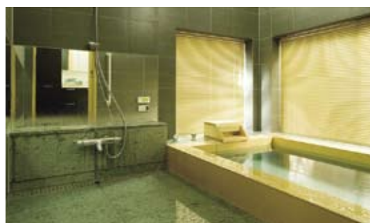
十和田石とヒバ材浴槽