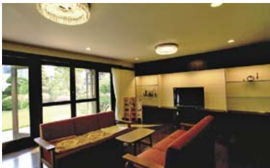
リビングルーム 正面の造り付け家具を撤去、 壁タイルを貼りました。

施工完了 ご新築時に工事担当しました組合員が30年ぶりに改築のお手伝いをしましたO市S様邸です。ご家族のご要望にお応えし、新鮮な雰囲気のある住みやすい仕上がりになりました。