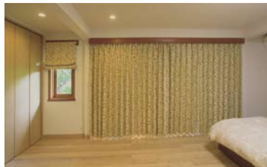
ベッドルーム 和室から洋室に。