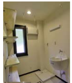
ランドリールーム 納戸から変更。