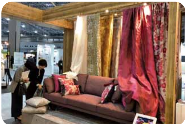
(株)川島織物セルコン

お住まいに関するあらゆるお困りのこと、 お悩み事などお客様とご一緒に解決します！ お電話は