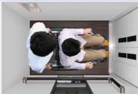
3人乗りタイプ(スイ〜とホーム ファミロング)車いすもご使用いただけます。

法改正によりホームエレベーターの取付けも容易になってきました。上下階の移動も楽に出来ます。三菱日立ホームエレベーター(株)と提携し設置の計画から工事、完成後のメンテナンスのご案内に至るまでしっかりとサポート致します。