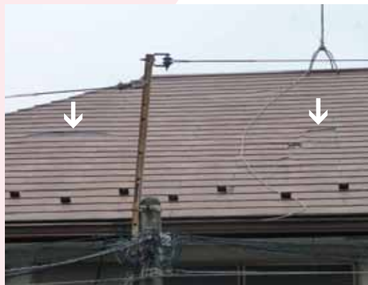
昨年の台風によりコロニアル葺きの屋根が破損しました。