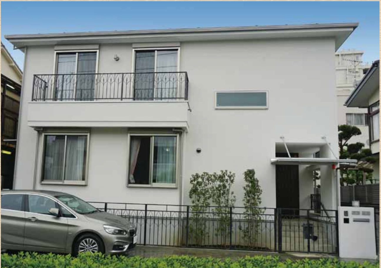
世田谷区K・T邸新築工事 完成しました。

輝く新緑が眩しい季節を迎えました。樹々の芽吹きは生命の息吹そのままです。皆様にはいかがお過ごしでしょうか？