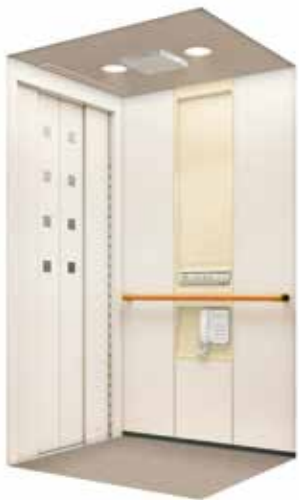
三菱日立ホームエレベーター(株)「スイ〜とホーム DX ファインウッド」

←既存の建物にもピッタリ対応できる 省スペース。安全性、快適性に加え省エネの点でも毎日安心して活用頂けます。