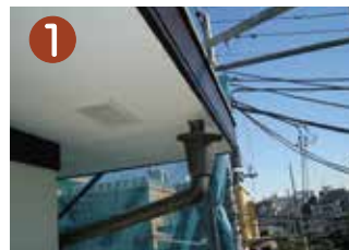
① 樋からの雨漏れで軒裏に水がまわる事も

家電製品の使用が増えの電気の容量不足、エアコンの不調による交換や増設、インターホンの不具合、照明のLED化、外灯の器具交換など電気設備に関する様々なご相談をいただいております。