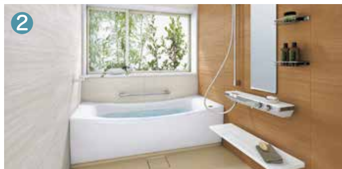
TOTO システムバス サザナ