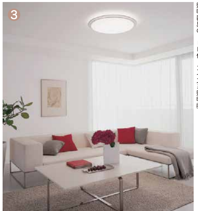
③ 照明器具のLED化 コイズミ照明機