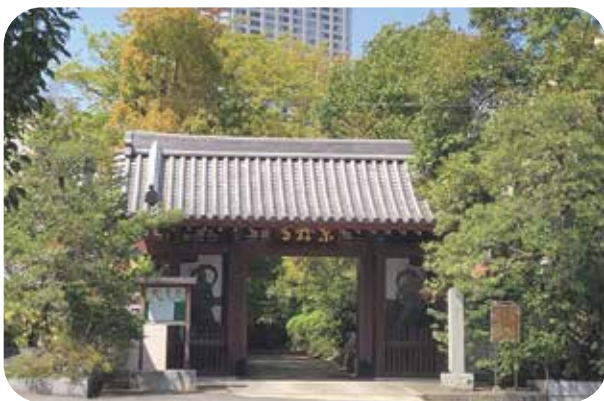
国指定史跡 高輪「東禅寺」