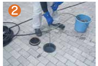
② 部屋の中だけでなく外回りの排水管も高圧洗浄