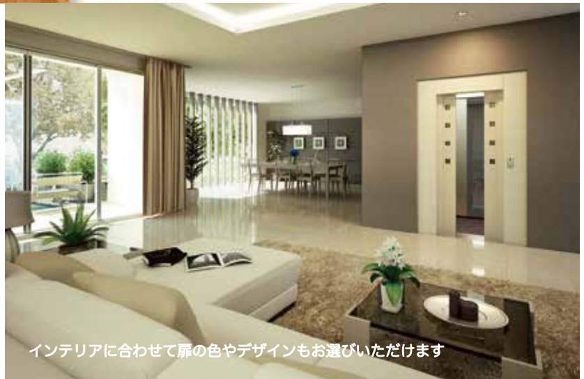
インテリアに合わせて扉の色やデザインもお選びいただけます

←既存の建物にもピッタリ対応できる 省スペース。安全性、快適性に加え省エネの点でも毎日安心して活用頂けます。