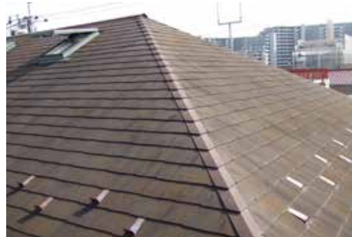
屋根塗装が経年劣化

最近、急な訪問者が「おたくの屋根が破損しているので点検しましょう」と屋根に上り、修理費用を請求された、また破損部分の写真を見せられ工事を迫ってきた等のご相談が多数寄せられています。ご心配であれば、まずはご相談下さい。確認にお伺いします。