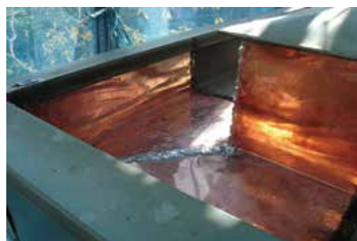
箱樋内部銅板の補修例