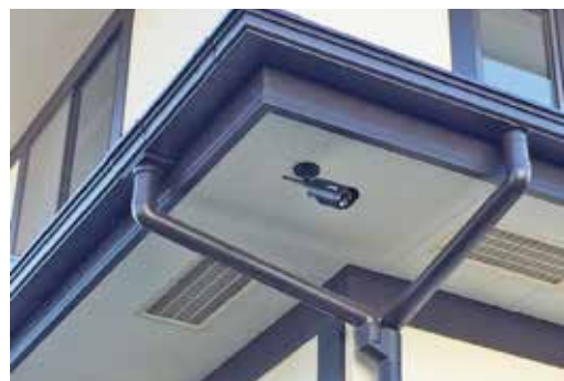
既成品雨樋の交換例

台風・大雪後は特に注意して目視点検をしておきましょう。場合によっては火災保険の適用が可能になります。尚、外付けの雨樋の劣化が進んでいると、新規交換が必要になるケースもあります。