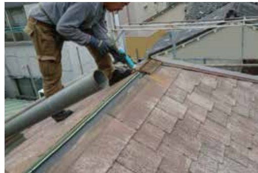
棟部分の板金が台風により落下