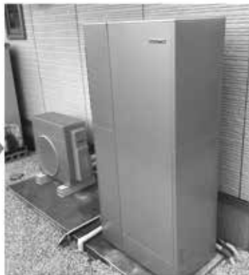
ECO ONE (160L タンク暖房)

リンナイ担当者と共に直接ご説明に伺います。 お客様のコストシミュレーションもご提案します。