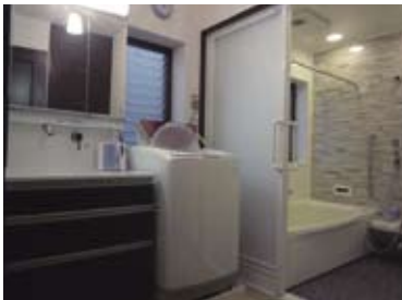
洗面・浴室改装 (バリアフリー)

『住まいのリフォーム』と一口に言っても◆建物本体、内装、水回りなどの住宅設備の 経年劣化(老朽化)に対応する工事 ◆ご家族のライフスタイルやライフステージの変化に対応した 快適さを求める工事 ◆耐震性向上など住まいの 安全安心を高めるための工事 とさまざまです。